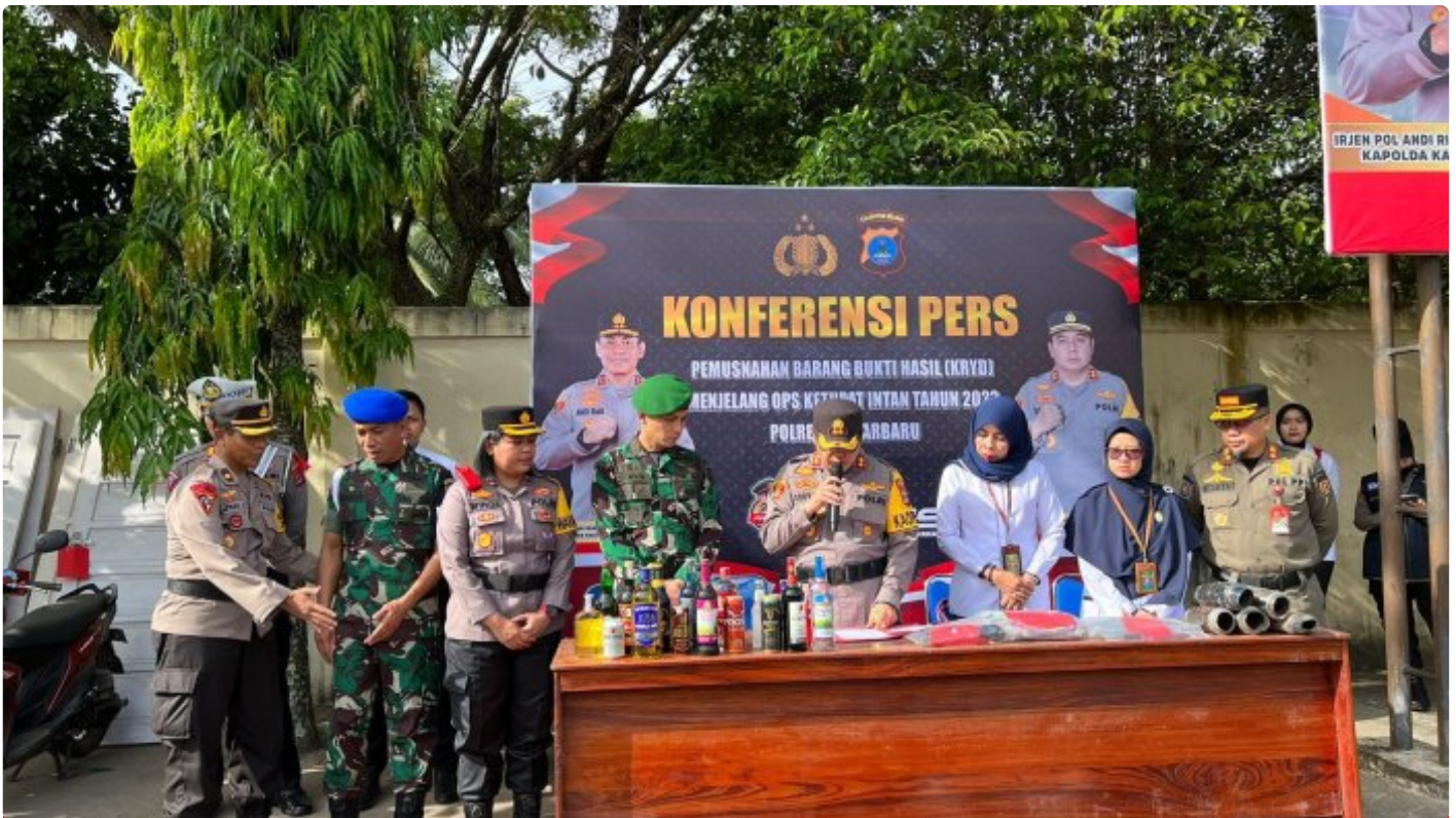
Kapolres Banjarbaru Bersama Dandim Banjar Musnahkan Ribuan Miras dan Ratusan Knalpot Brong di Kota

BANJARBARU - Ribuan minuman keras (miras) dan ratusan knalpot brong dari hasil sitaan polisi selama Ramadan, dimusnahkan di Polres Banjarbaru, Senin (17/4/2023).